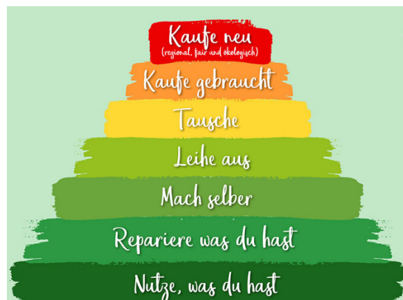
Abbildung 1: Die Pyramide des nachhaltigen Konsums. https://www.smarticular.net/nachhaltig-leben-und-konsumieren-einkaufen-pyramide-tipps-fuer-den-alltag/