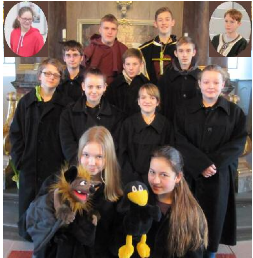
Die Brokdorf-St. Margarethener Konfirmandengruppe bei der Probe für einen Reformations-Wettbewerb