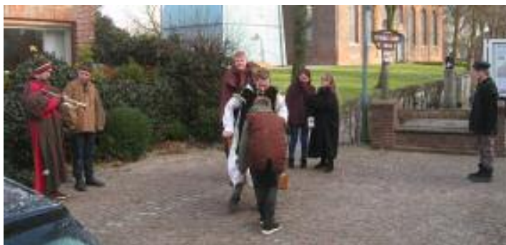
Szene von den Vorarbeiten vorm Dollinghus in St. Margarethen

Nun wartet die Gruppe gespannt auf das Ergebnis, ob sie zu den Gewinnern gehört. Zu sehen sein wird das sprechende Bilderbuch per Beamer und Leinwand bei den Konfirmationsgottesdiensten. Seien Sie gespannt!